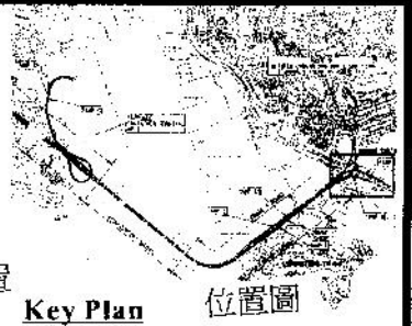
圖 2 所示位置